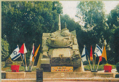
טנק הצוערים באנדרטה המחולקת בבסיס מצ'לה, צרופין

אם השמשתות על מיטק האנדרטה נובע בני' היתר מהקצרות כי הם מתקשים להיכנס לכסיס שהוא כסיס סגור. אמו של נמרוד גיית ז'ל, רות כרמי, סואבת את העובדה הזו על עי'ם. "אני חושבת שטנק צריך להיות בלטרון, גם הכן וכל להיות נגיש לכלים. בני' יום סוק שהטנק נמצא בו היום הוא פשוט טנק ז', בלטרון הוא ישלכ' בנג'ר הבוער". במקום שהטנק נמצא בני' פנימייה אליו ריון,