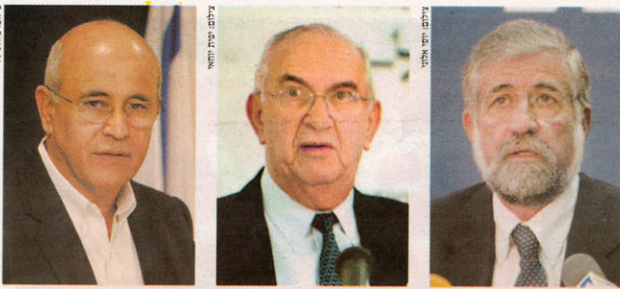
מאשר מצעו, משמר ניצן, וזכר קהלני

"ואו לאטילאט הם חוזר על זה שוב, תבואו, תוציאו אותנו, ממש מין תחינה כזו ונרמו. אני גם זוכר את עצמי עומד בצריח, בחושך, מטרונות של החווה הסינית, ומנסה בעיניים טרוטות לראות אותם. וזה הקטע הכי איום וגורא שיש. מבחינתי מוכרחו, מבחינתם כמוזן פי מיליון גרוע. כי הם נהרגו. אני הייתי מיוסר מזה שנים"