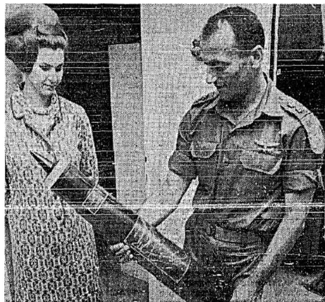
למזכרת: מגן ועליו חרותים מהלכי המלחמה

למבואות אל-עריש הגענו עם הטיפות האחרונות של הדלק. אני עצמי עשיתי עם הזחל"ם שלי פטרולים על הכביש, כדי שיידעו כי אני קיים. תוך כדי פטרול יריתי בכל עצם השודר שצף מולי. לפתע יוצא מולי טנק פיקוד מצרי וחוסם לי את הכביש. זה היה בין פסי הרכבת ו" חורשת הדקלים. התלבשתי על ה„אפסי חמש" שלי ויריתי. הטנק נעמד, והצוות התחיל לברוח. התקרבותי אליו זורקתי