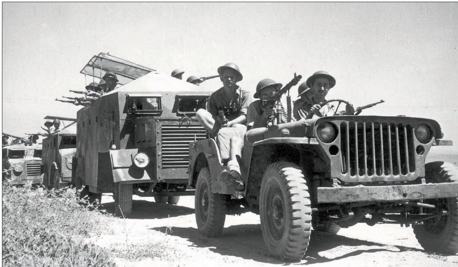
שיירה ישראלית במלחמת העצמאות. "אנשי קיבוץ נגבה לא יכולים היו להוציא את הראש החוצה"

"כשהשתחררתי מבית-החולים ובתי הבראה, שלחו אותי לקיבוץ אשדות יעקב. אחרי חודש-חודשיים צריך להתחיל לעבוד, אבל עדיין בקושי עמתי על הרגליים. אז מכיר הקיבוץ אמר לי: 'תלך