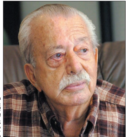
ליטנו היום. כמעט נשכח בבונקר