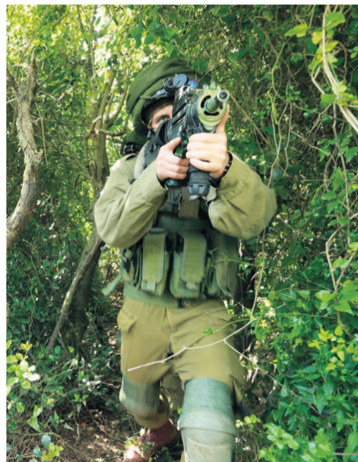
לוחם אגוז בפעולה. "לומדים להיות אקטיביים"

"מצד שני", אומר קצין בכיר במילואים. "אנחנו הרי לא מחלקים גולות ציאניד ללוחמים שלנו. אפשר להגיד לחייל 'תמנע חטיפה ככל מחיר', אבל אתה לא יכול לדרוש ממנו להתאבד. זה מסוג המשפטים שאומרים בתדריך לקראת יציאה, לא אחרי אירוע, כפי שעשה א". סביר להניח שלו ע' היה מנווט עם בן זוג, הגנבים לא היו מנסים לחטוף את נשקו. האירוע, לפיכך, העלה על סדר היום הצה"לי את סוגיית ניווטי הבדד.