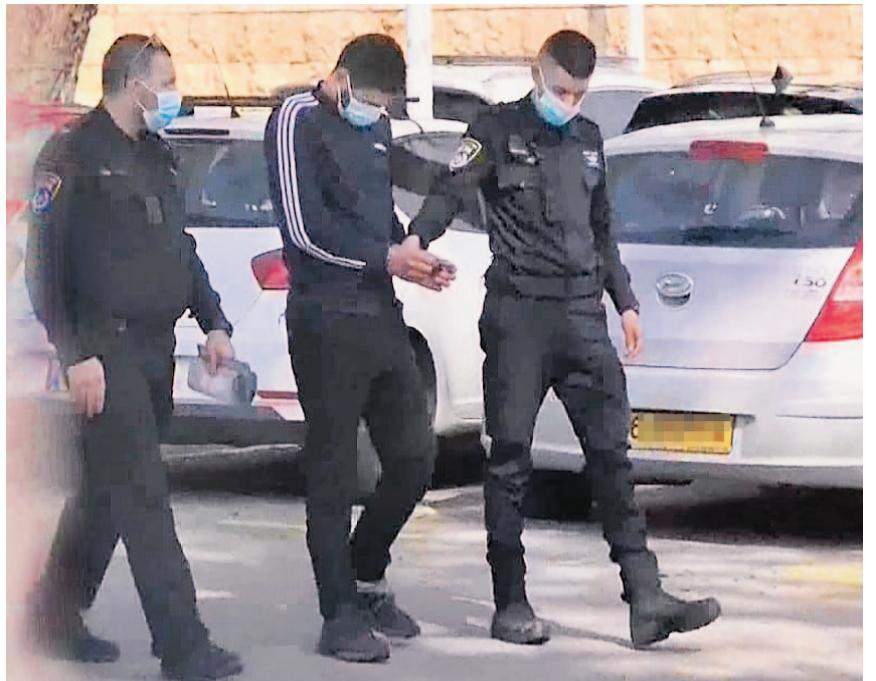
מעצר אחד החשודים. גם הם יצאו חבולים