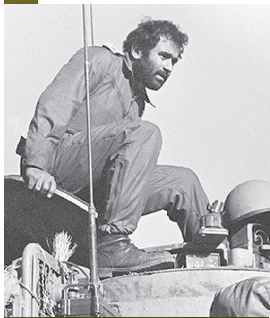
קהלני במלחמת יום הכיפורים

"שלוש לפנות בוקר הוא פונה באמבולנס לאיכילוב", מערכן הבן, "עשו לו בדיקת קורונה והוא אושפז בטיפול נמרץ. אבא יצא שלילי, אבל הכאב לא עבר. אני מכיר את אבא שלי, הוא אדם שיועד להכיל כאב כי הוא סבל מאוד. כאן נתפס לו הגב ויש לו פריצת דיסק, אבל די מהר הבנו שזה כאב מסוג אחר. אבא מתאר שזה כמו פולטיס, מכות חשמל לגב. אבא אומר שב־50 השנים האחרונות לא כאב לו בעוצמה כל כך גבוהה".