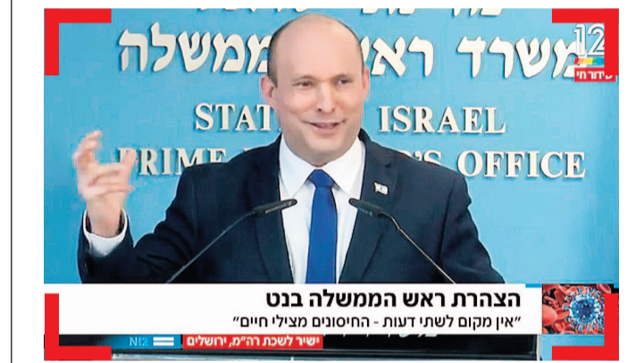
השד התגלה בתור ארנב חמוד. בנט

בחודשיים הראשונים לכהונתו, ראש הממשלה הפגין מקצת מהבר - סריות שלו ושל סביבתו - הרוב הולך על נושאים יותר משמעותיים - גם בתחום המגנע עם התקשורת. תחילה הוא הסתפק בהצהרות, ללא המטרד הקרוי "שאלות". אחר כך הומצא ז'אנר חדש: תשובות לשתי שאלות בלבד, של כתב שלא מסקר אותו בשוטף, בשוליים של אירוע בחסות פייסבוק. לפני שבועיים זה קרה בחודש "קשת" (מפגש עם אינפ' לואנסרס) ושלשום בחודש "רשת" (מפגש עם מנהלי קבוצות בפייסבוק). מעבר לביזאר העיתונאי, שבימים לא רחוקים כל כך היה זוכה לבי" קורות קשות, המעמדים הללו בעיקר הביכו את נפתלי בנט: מילא שזה נראה שהוא עובר מן המגניין בפייסבוק, כאילו שהיא לא בעיה בפני עצמה בכל הקשור להפצת פייק ניוז מדעי; איזה ראש ממשלה מדבר עם המדיה - כי למה להעלים את הביטוי "ראיון" - בסיטואציה שנראית כאילו אורגנה על ידי ועדת קישוט?