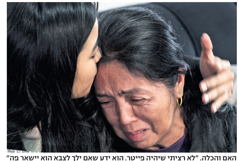
האם והכלה. "לא רציתי שיהיה פייטר. הוא ידע שאם ילך לצבא הוא יישאר פה"