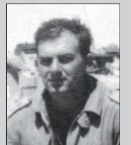
קיבל את: עיטור המופת מתני: מלחמת ששת הימים תפקיד: מפקד גדוד השריון 94 עיטור ביום: גמלאי