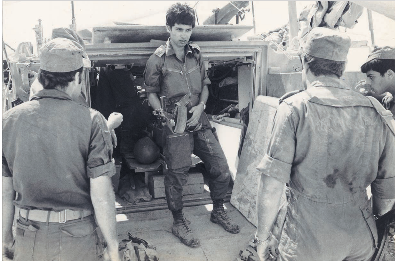
חודק כסרן בשריון. "שנים תהיתי למה אני נשארתי בחיים בעוד אחרים לא שרדו"

"בהתחלה לא ידעתי מה לעשות. עם אור ראשון הייתה תחושת מוכוה. לא ידענו מה יקרה הלאה, כי המצרים כבר השתלטו על המעוז כולו וירו עלינו מרגמות. עליתי על אחד הטנקים, התקשרתי למג"ד ודוחתי לו על מצבנו. שאלתי אותו מה