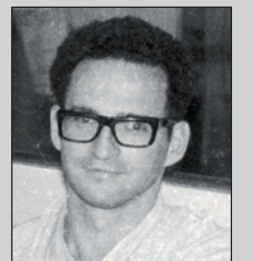
קיבל את: עיטור העוז מתי: מלחמת ששת הימים תפקיד: נהג טנק היום: מייצר פתרונות לחיסכון במים