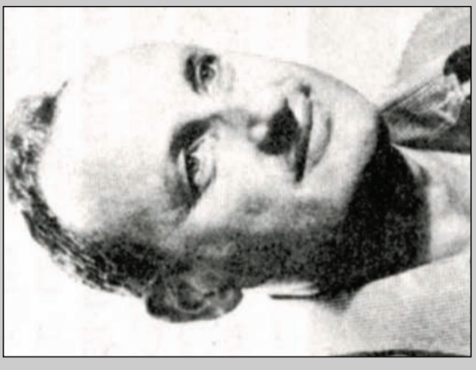
קיבל את: עיטור העוז מתי: מלחמת יום הכיפורים מבקר: בעת האירוע: קצין חימוש עיסוק ביום: גמלא"