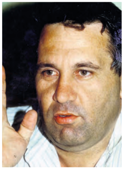
גבע. נוכח נפקד

"התכוננו למלחמה הזו כמו שלא הכינו אף פעם חטי"ב למלחמה", אומר היום אודי שני. "הרמה המקצועית הייתה יוצאת מגדר הרגיל. לאורך הזמן עמדו מולנו כמה תוכניות מלחמה: ארזים, דב צפוני א' ודב צפוני ב'. שב- תות שלמות ישבנו על נוהל הקרב עם הצנחנים. ישבנו עם חטיבת גולני על תוכניות לנחיתה בוהרני. עשינו