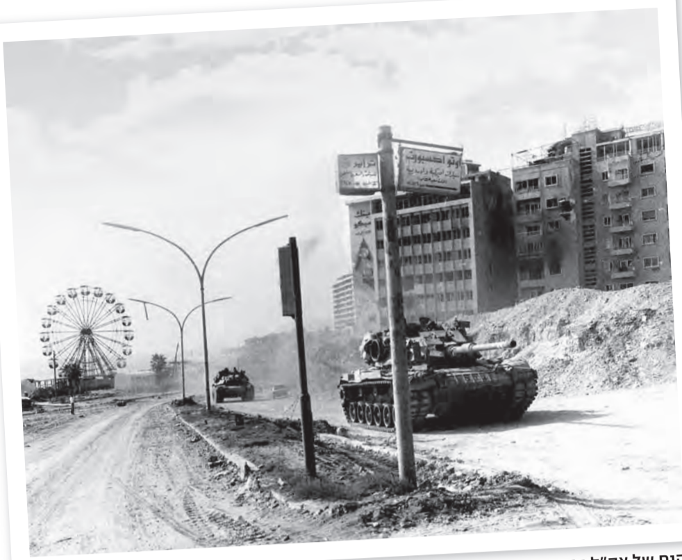
טנקים של צה"ל בביירות. "כיבוש בירה ערבית, גם היום, הוא לא עניין מופרך"

יחיעם. בכל פעם שחיפשנו את המח"ט, קיבלנו את הסמ"ח"ט. אולי הוא היה אז במסעות שכנוע בתל-אביב, אבל זה לא עניין אותנו יותר. הבנו שהוא כבר לא איתנו. "מאז לא דיברתי איתו ולא נתקלתי בו. יחיעם לקח את הפיקוד על החטיבה, אחריו הגיע בנדל, והמשכנו את המלחמה במערב ביירות".